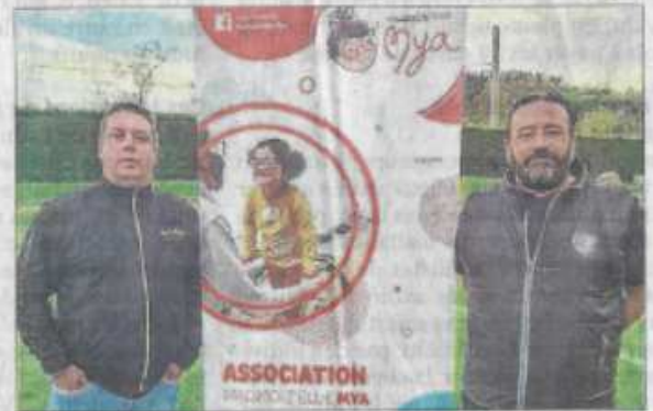
Le club soutient l'association Madmiz'elle Mya, et organisera une soirée caritative le vendredi 31 mars à la salle Victoria à Saint-Péray.

« Le football sur le plan local c'est au-delà de la pratique sportive et des résultats, c'est un encadrement, des valeurs, de l'écoute. J'ai la chance de pouvoir compter sur des salariés et des bénévoles passionnés qui donnent sans compter au club, mais je sais aussi que les équipes