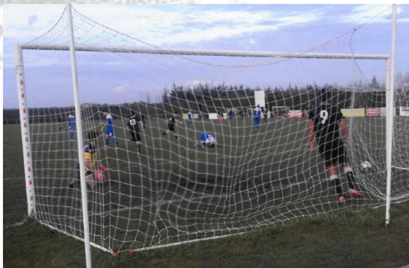
Le but de Dylan offrait une égalisation méritée à un quart d'heure de la fin

Les visiteurs très nerveux prendront un carton rouge mais finiront par l'emporter sur un dernier coup franc dans les arrêts de jeu. Une défaite 3 à 2 face à une belle équipe, on regrettera les deux buts encaissés sur coup franc qui nous coûte cher au classement ».