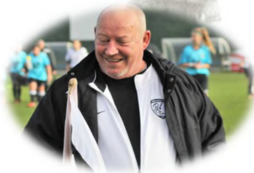
Francis supporter n° 1 – merci pour ton aide

Pourtant ce ne sont pas les occasions de marquer qui ont manquées !!