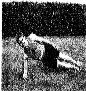
1) Gainage latéral côté droit

(*) 1 tour de gainage correspond à l'exécution des 4 positions suivantes :