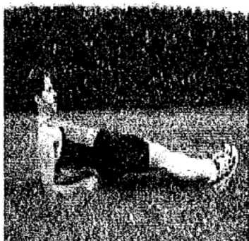
3) Gainage de dos