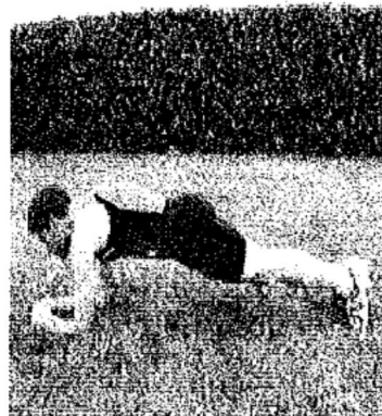
2) Gainage de face