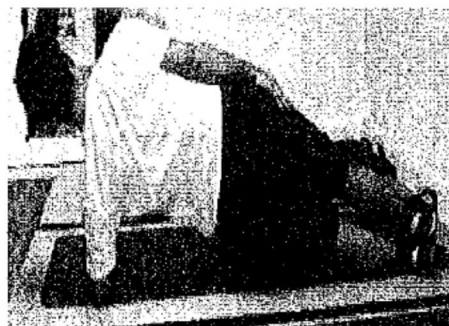
4) Gainage latéral côté gauche

Attention : Veille à toujours maintenir le dos plat